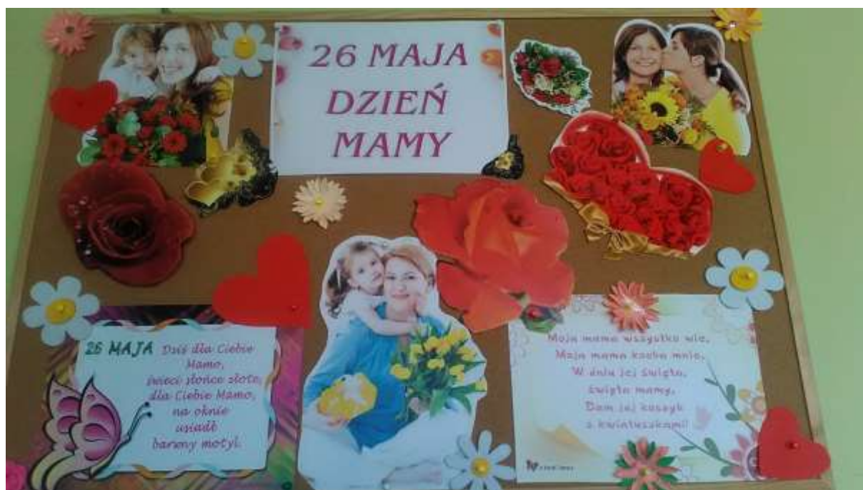
Gazetka okolicznościowa oddziału V, wykonana przez Janusza Słowika oraz Marka Błaszczakiewicza.